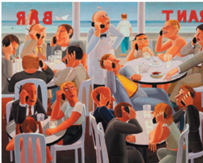
Je devrais peut-être m'acheter un portable.