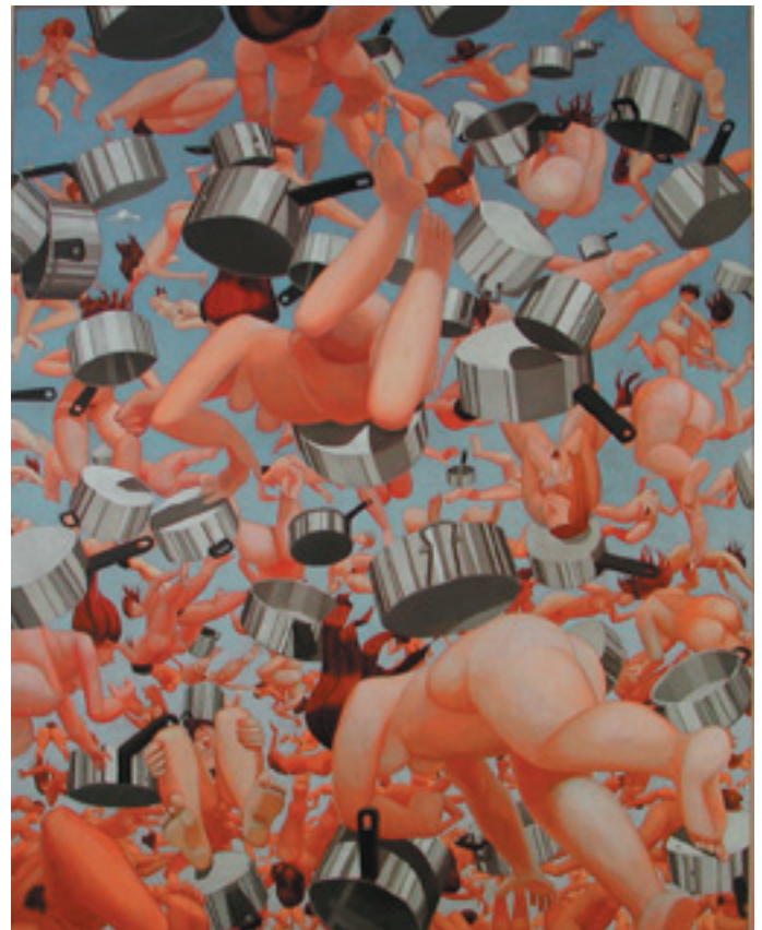
La fin d'une époque.