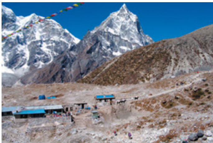
Sur la route de l'Everest.

Les paraboles de l'Himalaya ne sont pas destinées à recevoir la télévision mais à faire bouillir de l'eau. Au lieu de les diriger vers les satellites géostationnaires assurant la diffusion, on les oriente en direction du soleil ce qui explique la roue qu'on voit sur la photographie ci-dessus. Elle permet de régler la hausse de l'axe de la parabole. Pour le réglage de l'autre angle, il est nécessaire de porter la parabole pour la déplacer.