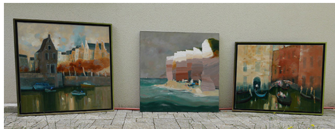
vue d'ensemble 3 tableaux

Catherine a également projeté un diaporama très complet et dense présentant l'oeuvre de l'auteur, hélas trop volumineux pour être placé sur notre blog, mais vous y trouverez, ainsi que ci-contre, une sélection de tableaux et de photos prises durant l'exposition. DB